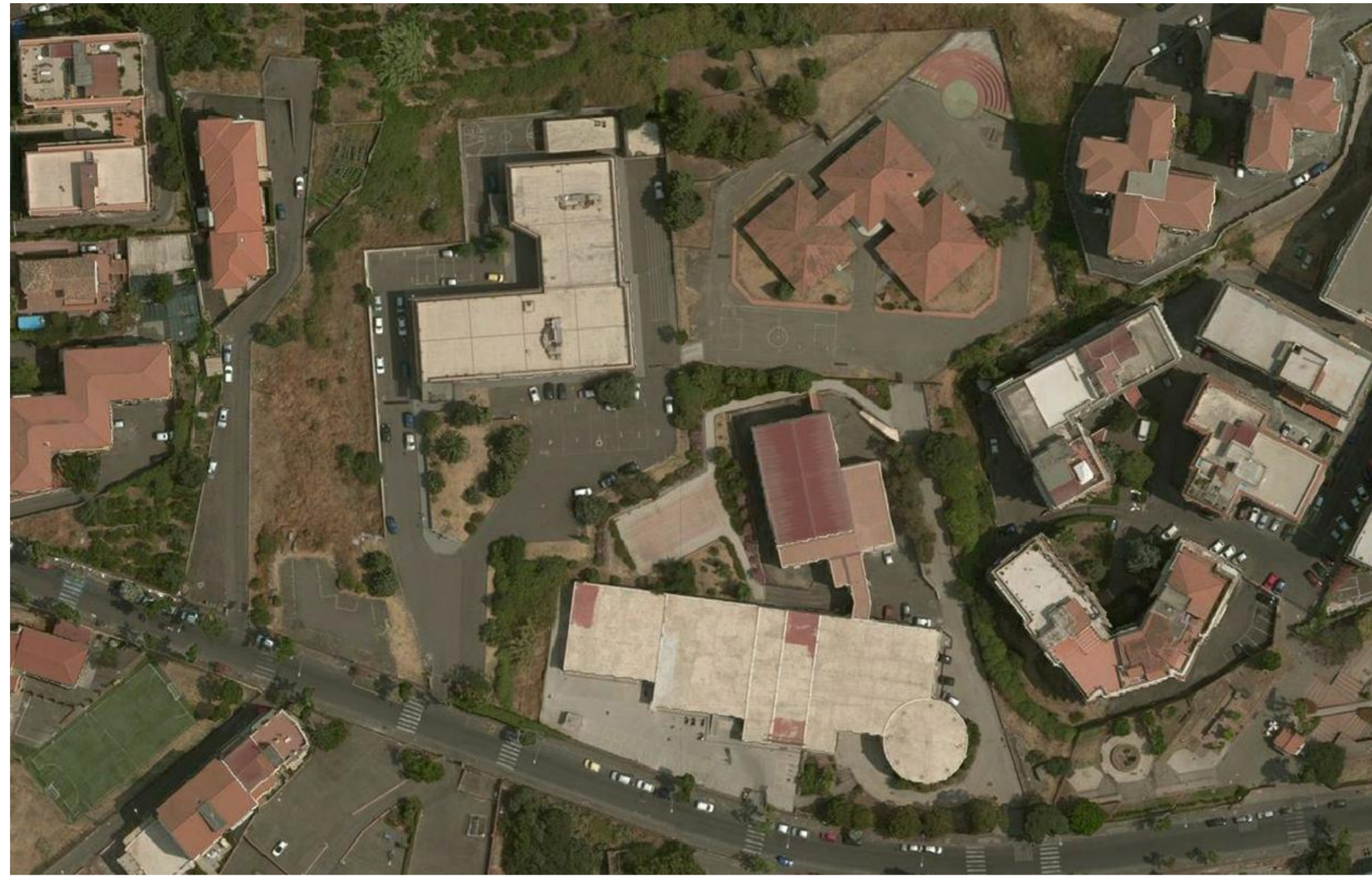
N VISTA AEREA